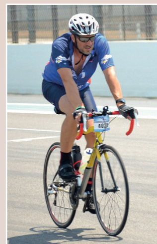
Christian dans les derniers tours